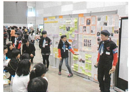
ふるさと創造学サミットでの発表

子どもたちは、浪江町の人々のふるさとへの思いを知り、ふるさとを誇りに感じ、ふるさとのために自分ができることは何かを考えるようになってきました。それと同時に、子どもたちの学習が、ふるさとを離れた浪江町の人々に大きな感動を与えることができました。