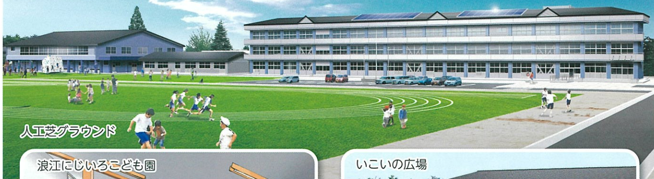
人工芝グラウンド